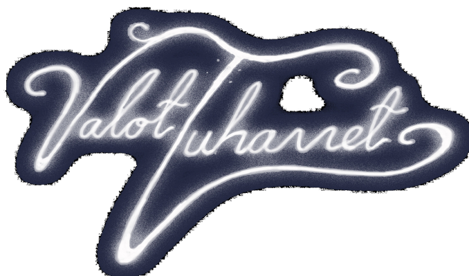
Kuva 1. Valot Tuhannet logo. Suunnitellut Unou Design.